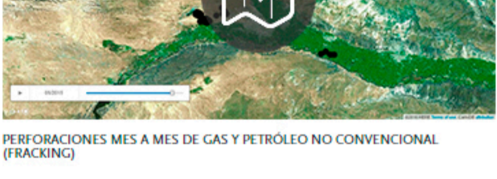
PERFORACIONES MES A MES DE GAS Y PETRÓLEO NO CONVENCIONAL (FRACKING)