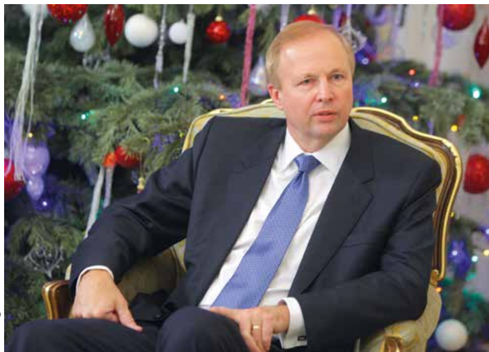
CEO (director) de BP Bob Dudley

BP se conoce por ser responsable de la mayor catástrofe de vertido de petróleo de este siglo, que se produjo en las profundidades marinas del Golfo de México en 2011. El pozo de petróleo Macondo explotó, incendiando la plataforma petrolera y matando a 11 trabajadores. El pozo, que BP intentó taponar sin éxito en varias ocasiones, vertió petróleo al océano durante 89 días, creando una mancha de 10.000 metros cuadrados de extensión y dañando por varias décadas los bancos de peces y crustáceos de los que dependían miles