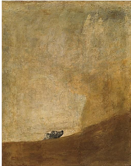
Francisco de Goya y Lucientes, Perro semihundido 1820 - 1823. Técnica mixta sobre revestimiento mural trasladado a lienzo, 131 x 79 cm

Para afinar el foco sobre el paisaje del siglo XXI podríamos, si cabe la paradoja, partir de una imagen del siglo diecinueve. La obra es bien conocida, pero volví a verla el año pasado en el Museo del Prado y me sorprendió no recordarla o, mejor dicho, comprobar que la había visto sin verla en otras visitas al Prado. Es el Perro semihundido , una de las doce "pinturas negras" que Francisco de Goya pintó en las paredes de la Quinta del Sordo, donde se recluyó abatido y enfermo entre 1819 y 1823. La modernidad de esas composiciones nocturnas de figuras grotescas y formas caprichosas nunca deja de asombrarnos –cuesta creer que tienen casi dos siglos–, pero por algún motivo que sólo razoné más tarde el Perro semihundido se apartó esta vez del resto y vino a recordarme que todo el arte es contemporáneo y que el arte de ayer dice otras cosas hoy, como bien supieron Pierre Menard y Jorge Luis Borges.