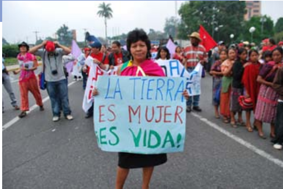
Encuentro Continental de los Pueblos de Abya Yala por el Agua y la Pachamama

"La madre tierra quedó preñada con una gota de agua" el cariño y fertilidad de la Pachamama posibilitó el alumbramiento de una gotita que multiplicó la vida en todas sus formas. La vida debe al agua como el árbol a la semilla; el agua nos trajo y aquí estamos para vivir, convidar y resistir.